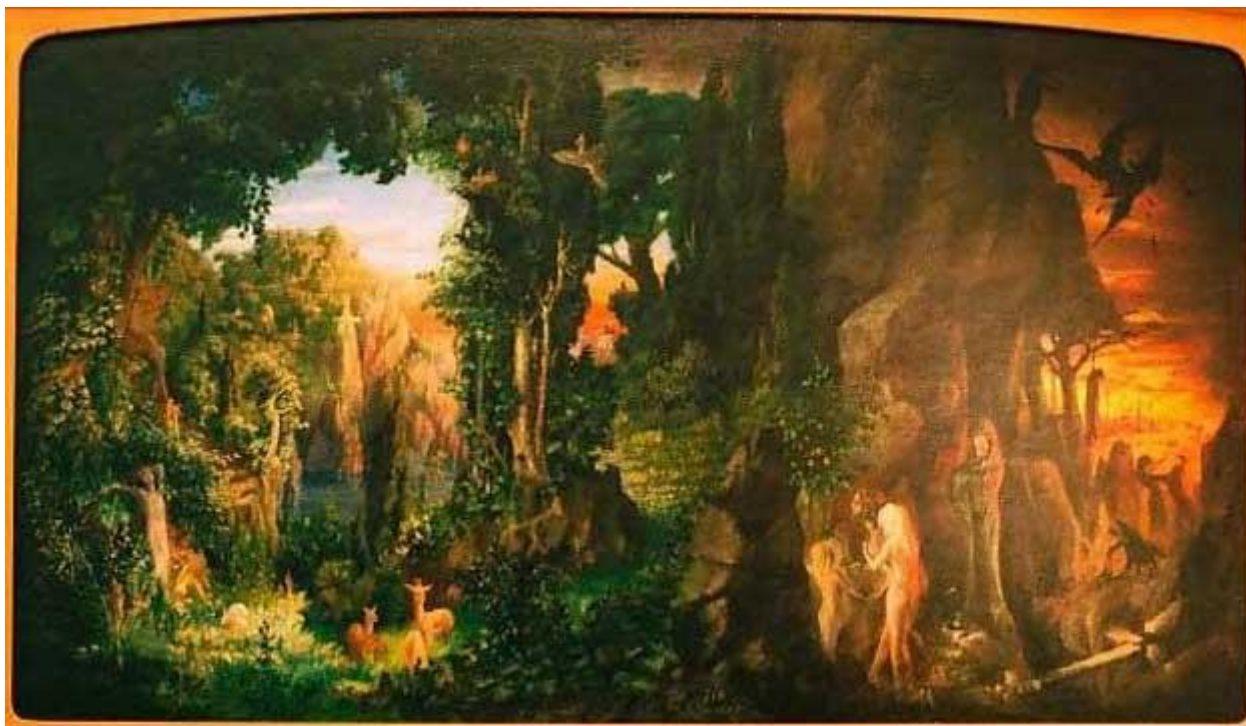
Der Liebe Macht

dezumaniza(n)tă, care se autodistruge, optând pentru renașterea într-o existență în armonie cu natura. Astăzi, pictura este expusă în Muzeul Casa Anatta, de pe celebrul Monte Verità.