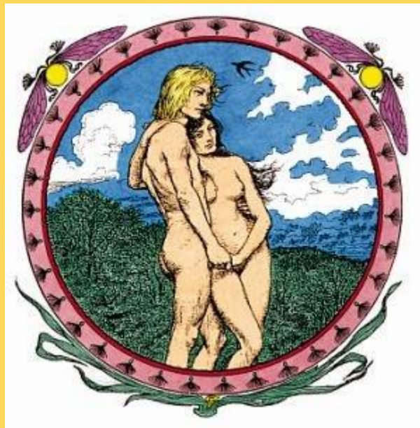
Een vignet van Fidus

De illustrator Fidus (1868-1949) ontwikkelde zich tot een belangrijke en baanbrekende psychedelische kunstenaar, vijftig jaar voordat de hippiebeweging in de rockmuziek met dergelijke iconografie op de proppen kwam voor haar platenhoesontwerpen.