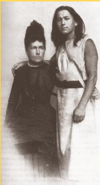
Fidus met zijn moeder. Interessant haar...

De symbolistische schilder Karl Wilhelm Diefenbach (1851-1913) werd een apostel van de alternatieve levensstijl, naturisme en vredesactivisme nadat hij, volgens eigen zeggen met uitsluitend natuurmethoden was genezen van de tyfus. Met vrouw en kinderen trok hij in de commune Humanitas , waar zijn vrouw in 1890 stierf. Omdat zijn leerstellingen in München niet op bijzonder veel sympathie konden rekenen, trok hij weg uit de grote stad. Hij ontmoette de jonge schilder Hugo Höppener, die door hem Fidus gedoopt werd. Getweeën maakten ze het grote schaduwfries Per aspera ad astra . Een schilderijtentoonstelling in Wenen maakte hem in 1892 in één slag beroemd, maar door malversaties van de leiding van de Oostenrijkse Kunstvereniging raakte hij vervolgens al zijn doeken kwijt.