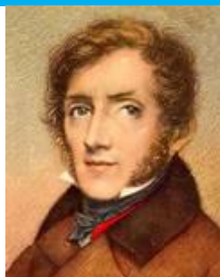
Alessandro Manzoni (1785-1873)

La formazione luganese dell'autore dei Promessi Sposi