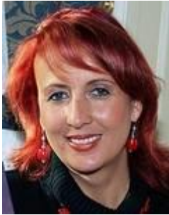
Corinne Hofmann (1960)

Un passato da criminale per uno scrittore... quasi asconese