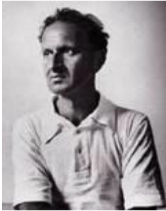
Yvan Goll (1891-1950)

Il Cabaret Voltaire di Zurigo, gli Stati Uniti e poi Muralto