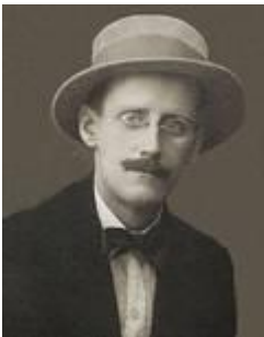
James Joyce (1882-1941)

Grande storico e biografo, ad Ascona trovò la sua dimensione