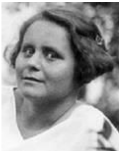
Lisa Tetzner (1894-1963)

Dalla guerra di Stalingrado alla tranquillità di Avegno