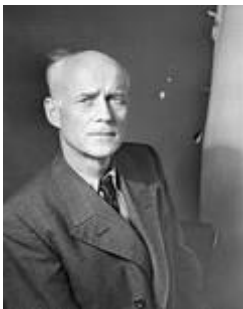
Theodor Plievier (1892-1955)

Dalla guerra di Stalingrado alla tranquillità di Avegno