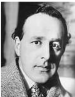
Emil Ludwig (1881-1948)

Ad Astano il rifugio malcantonese del poeta e filosofo