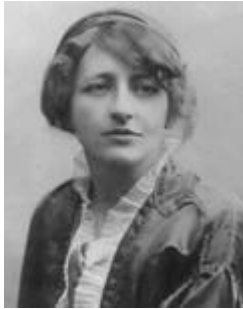
Franziska zu Reventlow (1871-1918)

Un lungo peregrinare conclusosi a San Pietro di Stabio